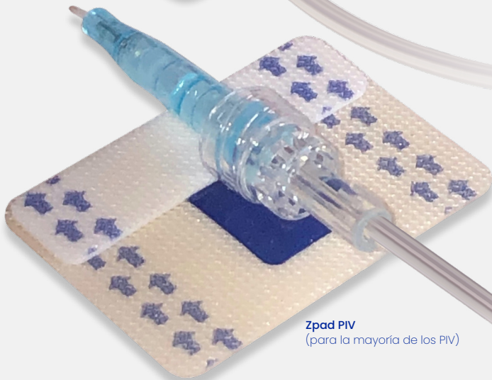
Zpad PIV (para la mayoría de los PIV)

PIVC, MIDLINE PARA PACIENTES ADULTOS Y PEDIÁTRICOS