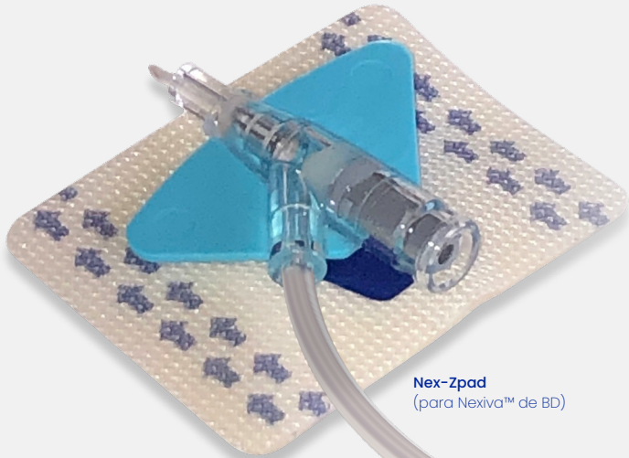
Nex-Zpad (para Nexiva™ de BD)

cojín para catéter y dispositivo de estabilización