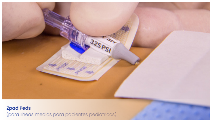
Zpad Peds (para líneas medias para pacientes pediátricos)

Ningún otro dispositivo de sujeción puede tener estas características únicas de protección.